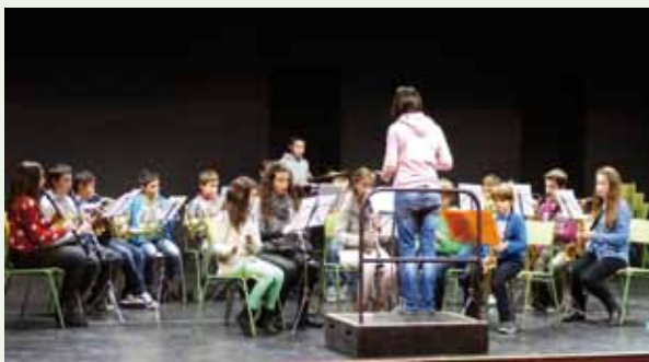
Los alumnos de la Escuela de Música, en acción.