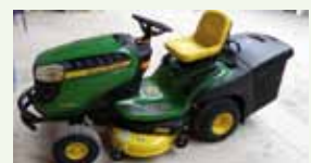
El tractor corta césped

El acto de entrega de diplomas a 70 establecimientos del destino turístico Montaña de Navarra que han apostado por el sistema de gestión de calidad MBP (implantación de Manuales de Buenas Prácticas) tuvo lugar en Aibar. Un total de 59 establecimientos han renovado en 2014 este sistema de calidad turística mientras que 11 se han adherido por primera vez.