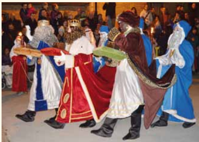
La Cabalgata de Reyes