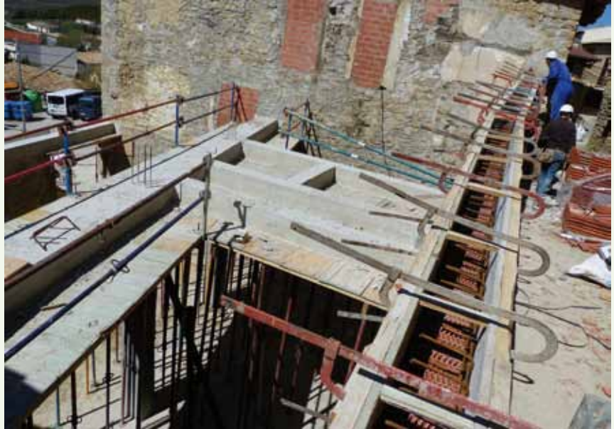
Obras en el futuro Centro de Día

Una vez realizadas las obras y el amuebla-