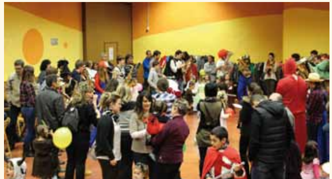
El carnaval infantil