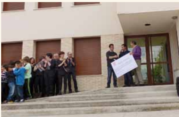
Un momento del 50 aniversario del colegio

A continuación la apyma del centro ofreció un aperitivo para todos los presentes con productos ofrecidos por varias empresas colaboradoras. Posteriormente, entre las 12:00h y las 14:00 se pudo ver una exposición de fotos y un aula antigua en el salón de usos múltiples del colegio exposición que fue muy visitada y motivo de infinidad de recuerdos y anécdotas. Hubo talleres de manualidades para los más pequeños, marquería, labores y juegos tradicionales en el patio del colegio. También tuvo mucho éxito una extraordinaria proyección del vídeo "50 años en 5 historias" en el auditorio Álvaro Aldunate. El vídeo es una producción hecha por alumnos del centro y por vecinos de nuestro pueblo que se ofrecieron para contar su testimonio.