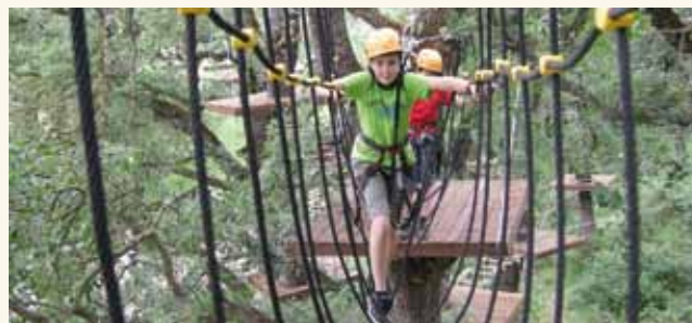
El Parque de Aventura Artamendía