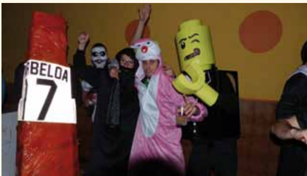
Los jóvenes se disfrazaron