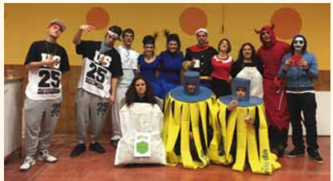
Una cuadrilla de Aibar disfrazada