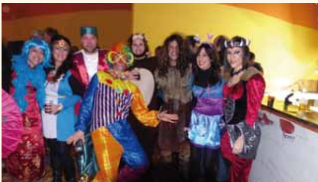
Un grupo del carnaval de Aibar