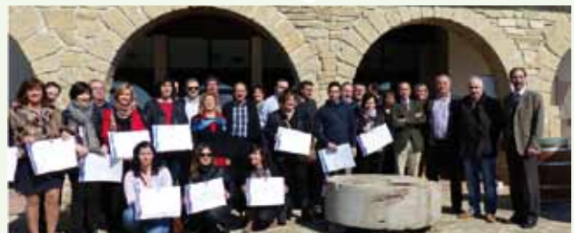
Los premiados, en Casa Zabaleta