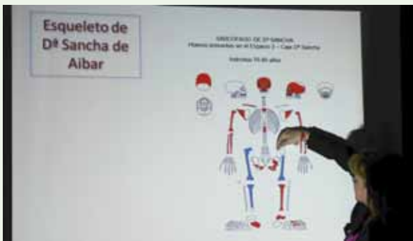
Un momento de la charla sobre Doña Sancha de Aibar.