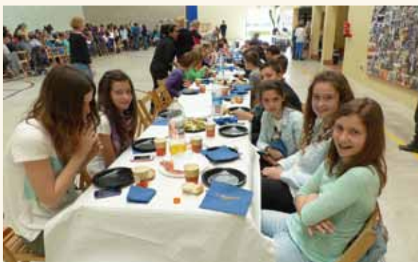
Un 50 aniversario popular