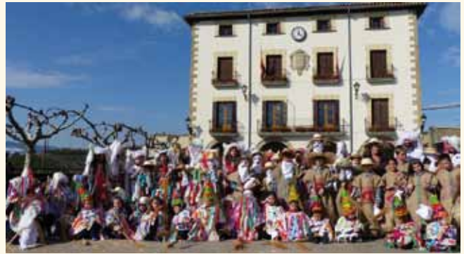
El carnaval del colegio

El carnaval de Aibar-Oibar se celebró en febrero con notable participación e infinidad de disfraces. Hubo cenas por cuadrillas y otra popular en el auditorio municipal y mucha música y juerga hasta altas horas de la madrugada. El premio de los disfraces fue para la pareja de las fregonas Vileda. También se celebró el carnaval infantil con buen ambiente y participación a pesar de la jornada lluviosa que acompañó durante toda la fiesta. Hubo maquillaje, chocolatada y fiesta con música y txaranga. Y como prolegómeno de todo ello estuvo el carnaval escolar en el que participaron alumnos, padres y profesores. Hubo desfile por las calles, música y almuerzo.