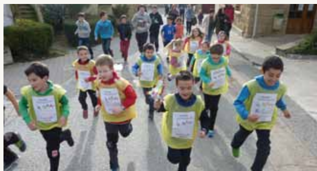
La Korrika Txiki, por las calles de Aibar

También se sorteó una cesta para recaudar fondos elaborada con productos regalados por los diversos establecimientos de Aibar.