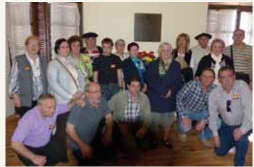
Los familiares posan con la placa en el salón de plenos

Por otra parte, una nutrida representación de Aibar-Oibar –el alcalde y familiares de los asesinados– estuvo presente en el acto de colocación de una placa conmemorativa que el Parlamento de Navarra puso en su sede como homena-