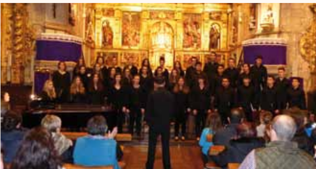
El orfeón juvenil Pamplonés, en la iglesia de San Pedro