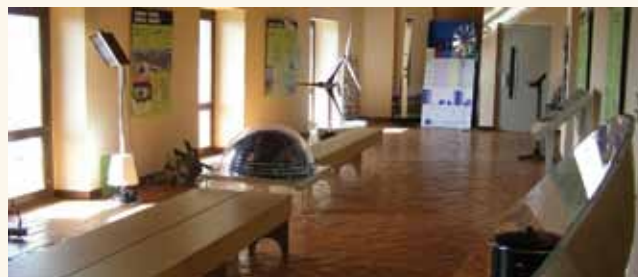
El Aula de Energías Renovables