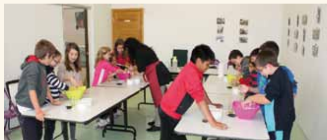
Un grupo de niños, en el Museo Casa de Aibar

Por su parte, el parque de aventura Artamendía abrió de nuevo el pasado 19 de marzo con bastante éxito. Al principio se abrirá los fines de semana, y a partir del 21 de junio, todos los días con horario continuo de 11.00 a 19.00 (los meses de menos luz) y de 11.00 a 20.00 los de más luz. Los interesados en visitarlo pueden llamar al tel. 629 991 337, escribir al correo info@parqueartamendia.com o visitar la web www.parqueartamendia.com . Según la memoria de actividades de 2014, el parque lo visitaron el año pasado un total de 1.836 personas.