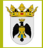
Ayto de Gallipienzo Galipentzuko Udala