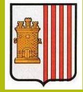
Ayto de Rocaforte Rocaforteko Udala